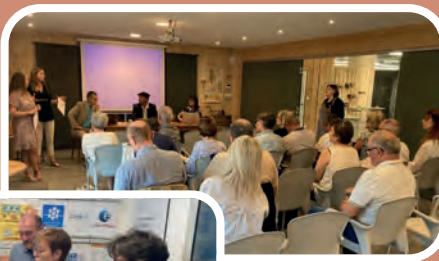
Séminaire des Présidents Cantonaux à Bougue