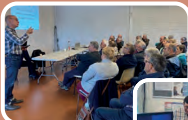
Conférence prévention santé à Domezain