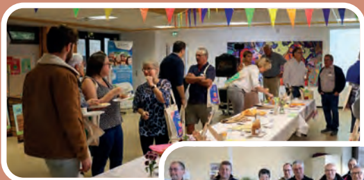
Action commune sur le site de St Pierre-du-Mont

Au programme, petits déjeuners de produits locaux, ateliers prévention santé, compostage, échanges et convivialité.