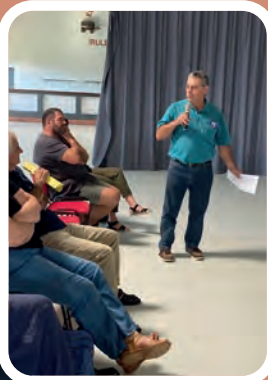
Réunion d'information à Irouléguay