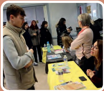
Forum des métiers à Castelnau-Chalosse