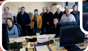
Les délégués MSA visitent le site de St Pierre-du-Mont