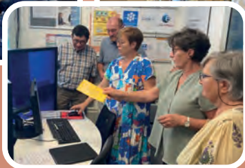
Visite de l'Espace France Services de Thèze