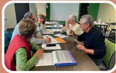
Formation «mobiliser les délégués» à Aire-sur-l'Adour