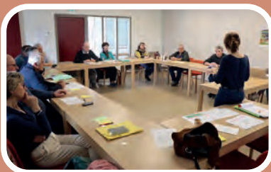
Plan mal-être : formation «Sentinelle» à St Palais